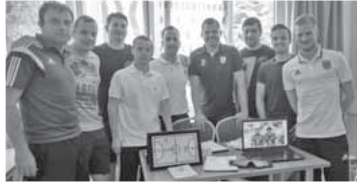
Schiedsrichterlehrgang in Krakau zur Vorbereitung auf das anstehende Turnier

und ganz unverbindlich bei einem der Blindenfußballspieltage vorbeischauen. Der Eintritt ist bei allen Spieltagen wie immer frei. Wir Schiedsrichter, aber vor allem die Spieler würden sich riesig freuen! Weitere Infos zur Blindenfußballbundesliga gibt's unter www.blinden-fussball.de .