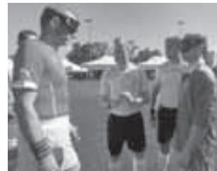
Seitenwahl beim Gruppenspiel zwischen Irland und der Schweiz