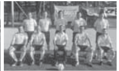
Schiedsrichterobmann aus Argentinien und Schiedsrichter aus Polen, Rumänien, Ungarn und Deutschland beim „3rd IBSA Blind Football European Challenge Cup & Referee Training Course“ in Krakau