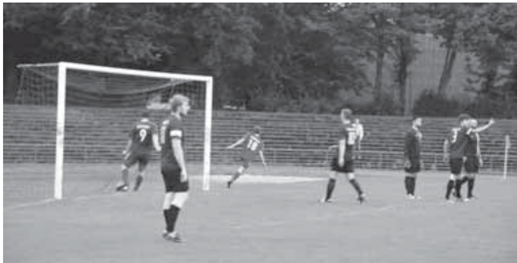
Torjubel beim 2:1 für die 2. Mannschaft in Erle 19