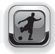
Tabelle A-Junioren Kreisliga A nach dem 3. Spieltag