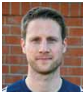
Stefan Kahnert Stürmer