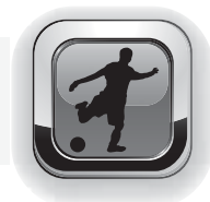
Tabelle A-Junioren Kreisliga A nach dem 4. Spieltag