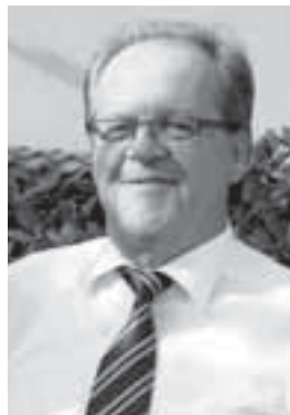
Mit sportlichen Grüßen

beim Oktoberfest der Landjugend auf Hof Steinmann, dessen Erlös zu einem großen Teil an unser Projekt „Aus Rot wird Grün“ gehen wird.