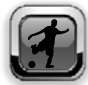
Tabelle VfB 2 nach dem 10. Spieltag