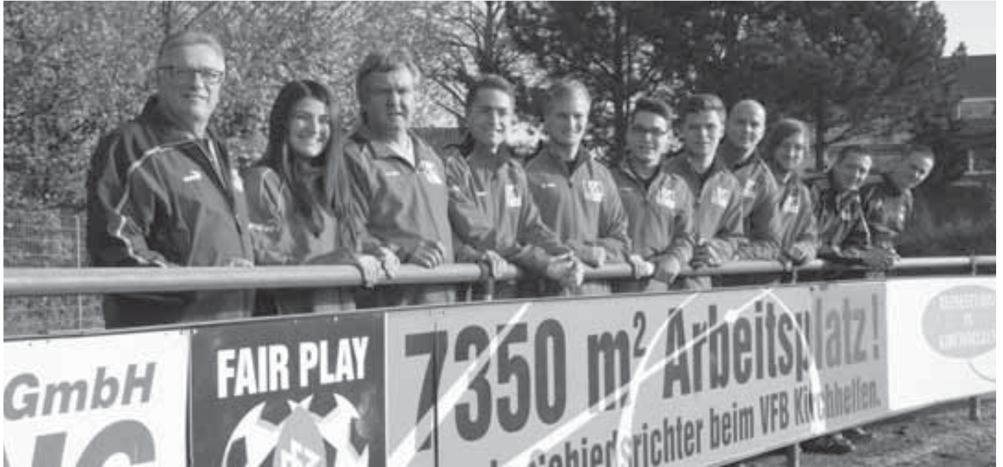
Ohne Schiedsrichter geht es nicht. Das erfolgreiche Team vom VfB Kirchhellen