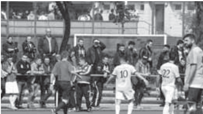
Der Trainer brauchte jetzt eine Ansprache