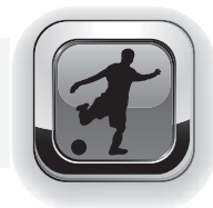
Tabelle VfB 2 nach dem 27. Spieltag