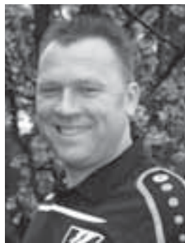
Mit sportlichen Grüßen

Ein wenig vom Pech verfolgt ist unsere III. Mannschaft: Abmeldungen von drei Mannschaften hatten prekäre Punktabzüge zur Folge. Der letzte (bewertete) Sieg unserer Dritten ist vom 13. März (!) datiert. Sie kommt an diesem Spieltag hoffentlich mit einem Sieg aus Bülse zurück, um gemeinsam mit allen Seniorenmannschaften, Vorstand und Freunden auf eine zurückliegende Saison anzustoßen.