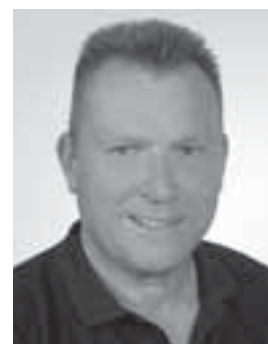
Mit sportlichen Grüßen

Gut zu wissen, dass es im Moment auch sportlich läuft: Am Fest-Wochenende konnte unsere I. Mannschaft in einem Geduldsspiel den VfL Grafenwald mit 1:0 bezwingen. Im Vorspiel drehte die Zweite gegen unsere Nachbarn einen 0:2-Rückstand in einen verdienten 3:2-Derbysieg. Eine Woche zuvor war auch die Dritte 3:2-Sieger gegen unsere Freunde. Derbysiege sind bekanntlich die schönsten Siege. Die Serie unserer I. Mannschaft ist sehr eindrucksvoll. Nach dem 5:0-Sieg bei der Zweitvertretung vom BV Rentfort genießt die Mannschaft mit 15 Punkten und 19:0 Toren die Tabellenspitze der Kreisliga A. Allen VfB-Mannschaften wünsche ich am Wochenenden den erhofften Erfolg.