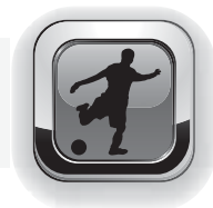
Tabelle VfB 2 nach dem 5. Spieltag