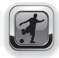
Tabelle VfB 2 nach dem 24. Spieltag