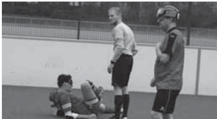
Foulspiel gibt es auch beim Blindenfußball

sicher mit 2:0 die Punkte mit nach Hause zu nehmen. Sprockhövel steht nach dieser Niederlage endgültig als Absteiger in die Oberliga fest.