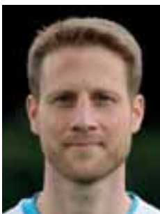
Stefan Kahnert Stürmer