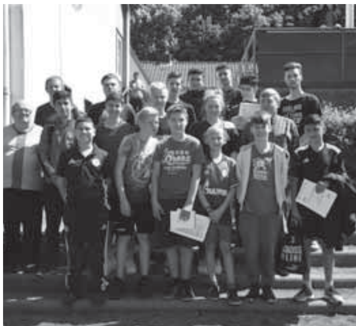
Die neuen Schiedsrichter des Kreis 12 GE